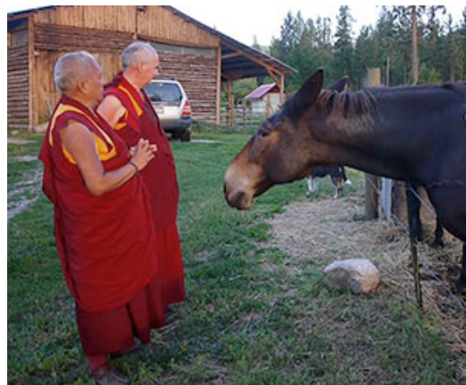
Lama Zopa Rimpoché y Ven. Roger Kunsang recitando mantras a los caballos. Washington, Estados Unidos. Julio 2012.

Bienvenido a la felicidad de las vidas futuras, bienvenido a la felicidad última, la liberación del samsara. Bienvenido especialmente al completo despertar y a la liberación de todos los seres de océanos de sufrimiento y su despertar.”