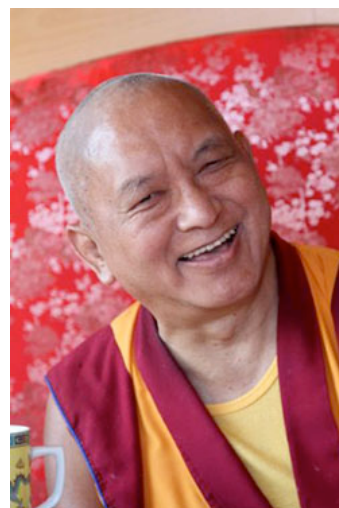
Lama Zopa Rinpoché, Washington, Estados Unidos. Julio 2012.