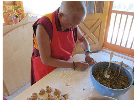
Lama Zopa Rimpoché cocinando momos Washington, Estados Unidos, Julio 2012.

En el retiro de mantras Mani en Ringchen Jansen Ling, Malasia, durante Saka Dawa se recitaron 24.840.528 mani mantras, y el mérito acumulado se dedicó para la larga vida de su santidad el Dalái Lama y Lama Zopa Rimpoché así como para el éxito de todos los centros, proyectos y servicios de la FPMT en el mundo.