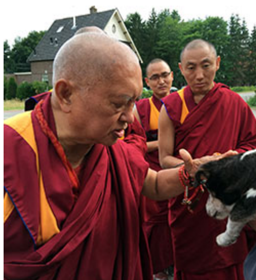
Lama Zopa Rinpoché bendiciendo a un perro de 17 años de edad, Maitreya Instituut Loenen, Holanda, Julio 2015.

« ... No hay ningún centro de la FPMT separado de los estudiantes. La FPMT es una verdadera organización de dharma dirigida con compasión, no es como dirigir una empresa. La organización va mejorando. Se gestiona con compasión. Es una organización de Dharma, cuida de la mente de las personas. ... ahora la FPMT está mejorando, básicamente hay mayor comprensión del dharma y mayor acumulación de mérito, por eso va mejor y mejor.»