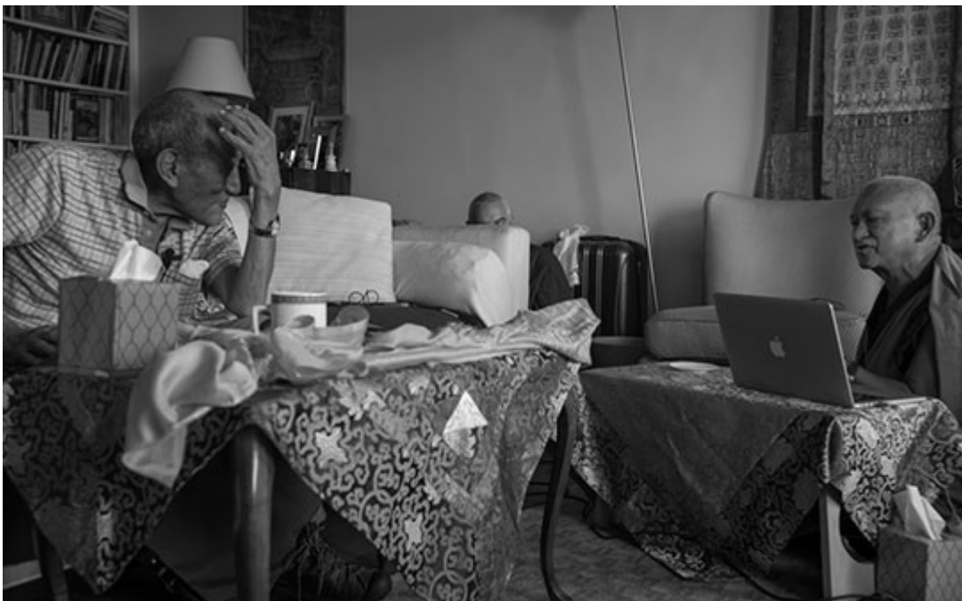
Khyongla Rato Rimpoché y Lama Zopa Rimpoché, Nueva York, USA, Agosto 2015.

Apúntate para poder recibir posts diarios de todos los blogs de la FPMT ( FPMT news ) vía email.