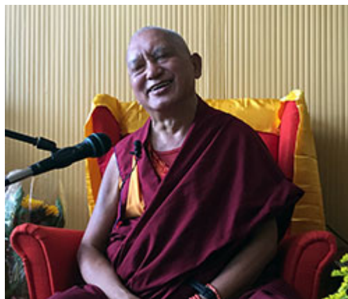
Lama Zopa Rimpoché en el Maitreya Instituut Loenen, Holanda, Julio 2015.

25 – 27 de septiembre: enseñanzas y retiro de Lam-rim, Centro Shiwa Lha , Brasil.