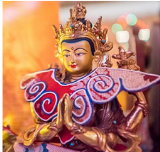
Una de las cientos de estatus de buda de Buddha Amitabha Pure Land, Washington, USA.