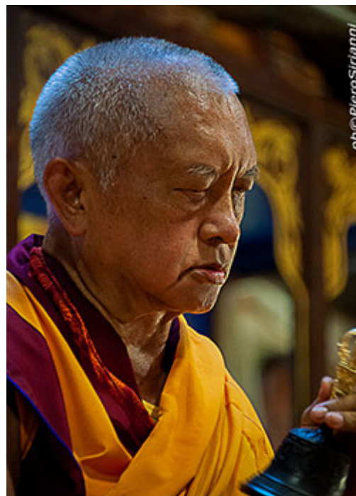
Lama Zopa Rimpoché en el Instituto Lama Tzong Khapa, Italia, Junio 2014.