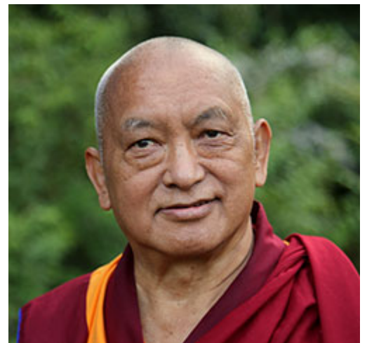
Lama Zopa Rimpoché, Leeds, Reino Unido, julio de 2014.