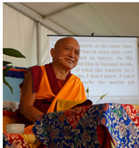
Lama Zopa Rimpoché enseñando en el Istituto Lama Tzong Khapa, Pomaia, Italia, Junio 2014.

Durante la reunión de la FPMT europea que tuvo lugar el mes pasado en el Istituto Lama Tzong Khapa, Italia, Lama Zopa Rimpoché dio una charla y en ella ofreció una breve enseñanza sobre los beneficios de ofrecer servicio al maestro. Te invitamos a ver esta enseñanza en inglés en video - teaching on video . Aquí os ofrecemos un extracto: