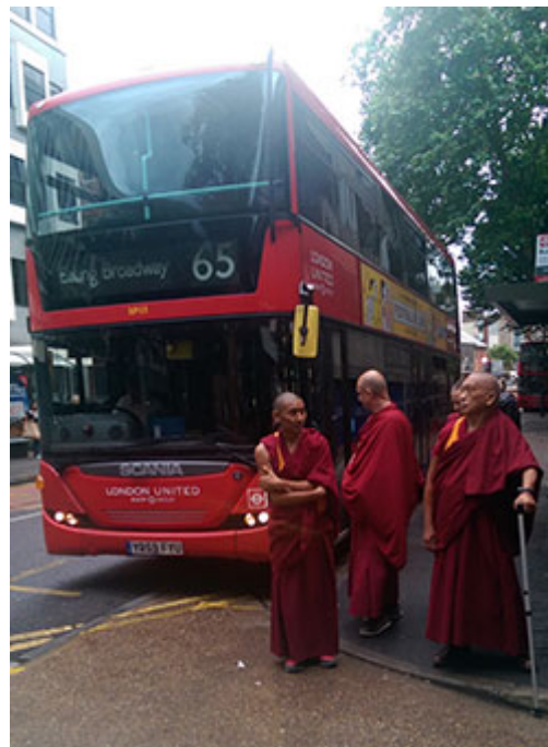
Lama Zopa Rinpoche en Londres, Reino Unido, Julio 2014.

Noviembre/Diciembre – enseñanzas durante el curso de un mes de Lamrim, Kopan Monastery , Nepal.