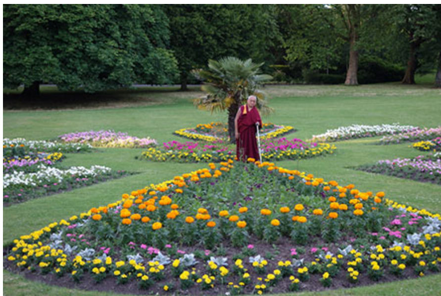
Lama Zopa Rimpoché ofreciendo las flores en el parque dedicado al maestro. Leeds, Reino Unido, Julio 2014.

Gracias en especial a todos los practicantes que han hecho ofrecimientos a la Caja de méritos. Su generosidad ha hecho posible estas ayudas y que el Proyecto Internacional de la Caja de Méritos haya estado apoyando la misión de la FPMT durante ya 13 años. Si quieres saber cómo unirte a este proyecto y formar parte de las ayudas entra en: Learn how to become a Merit Box practitioner and help be a part of the 2015 grants!