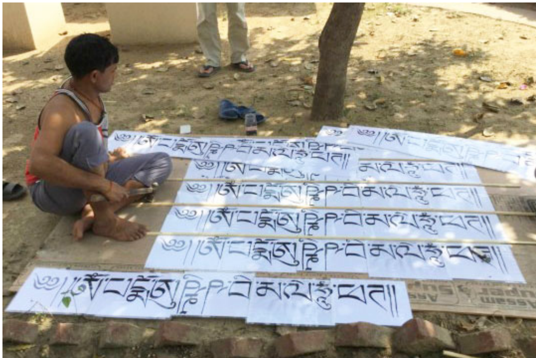
Mantras para el tejado del gallinero en el Root Institute, Bodhgaya, India, Marzo 2015.