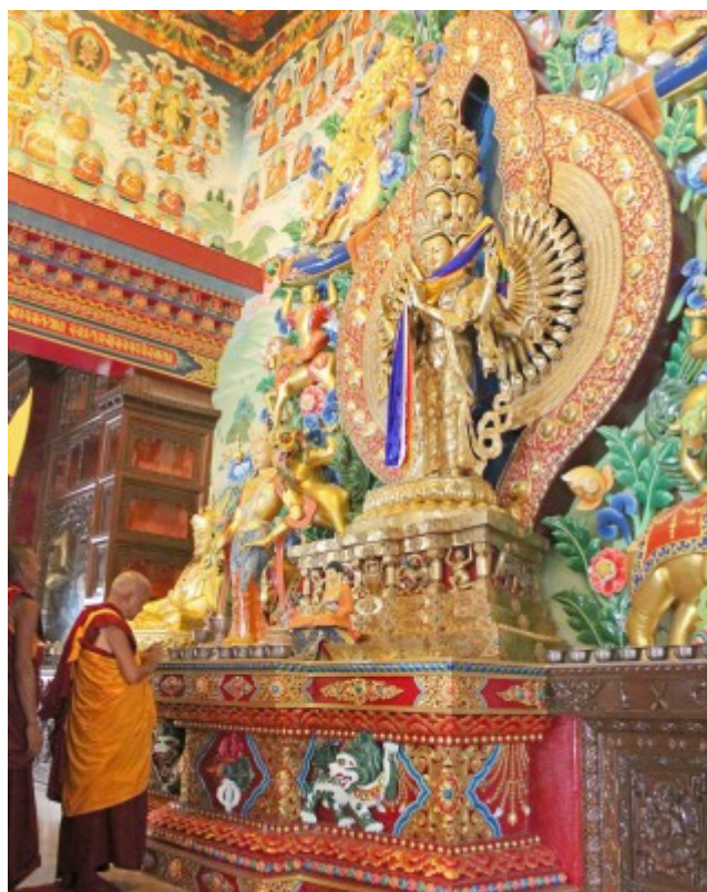
Lama Zopa Rimpoché frente a la estatua de Chenrezig mil brazos, estatua principal de la nueva gompa del convento de Kpán, Nepal, 30 de Abril, 2015.

Cuando Lama Zopa Rimpoché estaba visitando el Root Institute en Febrero 2015, rescató a un grupo de gallinas que había de una tienda de pollos y con el fin de seguir beneficiándoles lo más posible escribió el mantra de Pináculo del loto de Amoghaspasha para que se hicieran