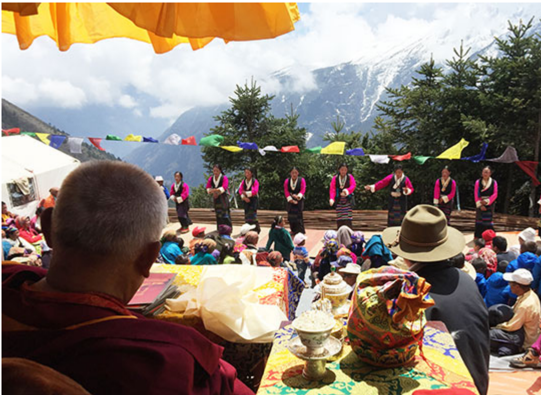
Mujeres sherpa ofrecen a Lama Zopa Rimpoché una danza antes de que otorgue la iniciación de larga vida de Amitabha frente a la gompa de Lawudo, Nepal, 21 de abril 2015.

Apúntate para recibir diariamente por email todas los blogs de noticias de la FPMT en inglés: FPMT news blogs .