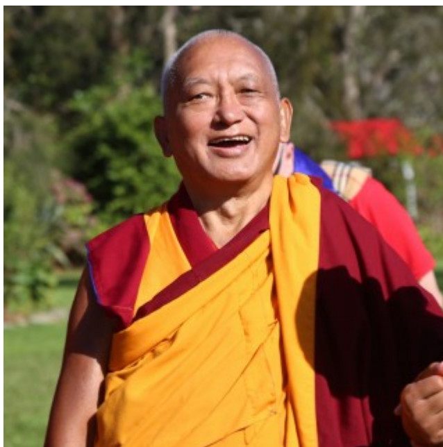
Lama Zopa Rinpoche dirigiéndose a la estupa del Centro Mahamudra para consagrarla, Colville, Nueva Zelanda, mayo 2015.