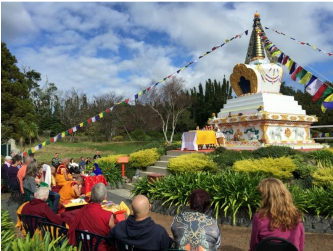
Lama Zopa Rinpoché consagrando la estupa del Centro Mahamudra, Nueva Zelanda, Mayo 2015.

(Este consejo va dirigido especialmente a aquellos que están ofreciendo este tipo de servicio).