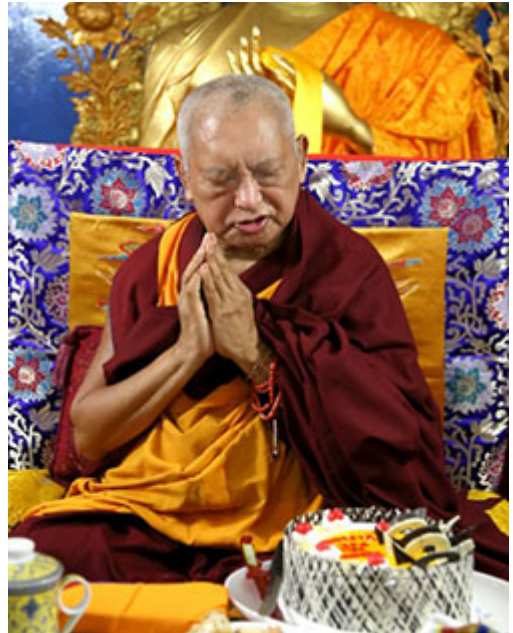
Lama Zopa Rimpoché en el Root Institute, Bodhgaya, India, febrero 2015.

Por favor, contacta directamente con los organizadores sobre cualquier cuestión relativa a los diversos eventos.