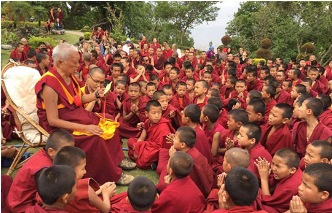
Lama Zopa Rinpoché con monjes y estudiantes occidentales en el jardín del monasterio de Kopán después del terremoto, Nepal, 25 de abril 2015.

Las noticias mensuales de la Oficina Internacional de la FPMT se encuentran traducidas al francés y español en las pestañas: «Bienvenue» y «Bienvenidos» de la página web de la FPMT o bien se pueden traducir a la propia lengua utilizando la correspondiente traducción localizada en la parte derecha de la página.