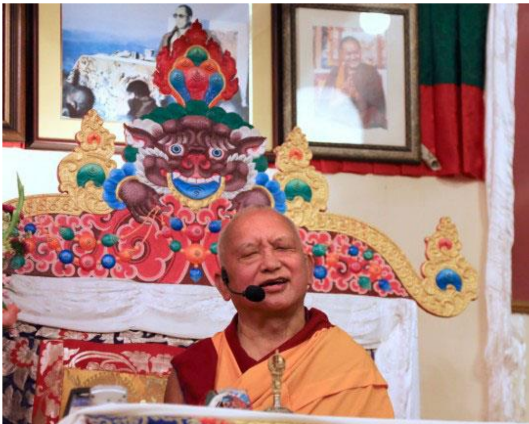
Lama Zopa Rinpoché en Land of Medicine Buddha, California, USA, Octubre 2015.