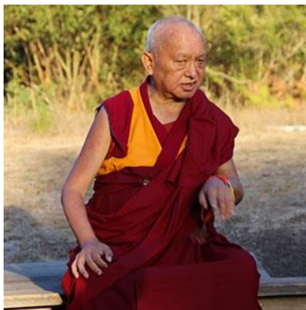
Lama Zopa Rimpoché en los campos del Land of Medicine Buddha, Soquel, California, Octubre 2015.

«La cosa más increíblemente importante de nuestra vida es el lam-rim. La práctica de los tres principales aspectos del camino es lo más importante. Lo más importante. Más importante que el trabajo, el dinero o cualquier otra cosa de nuestra vida. Es lo más importante,» Lama Zopa Rimpoché da estas enseñanzas en el módulo "Consejos para tener experiencias de Lam-rim," que forma parte de Vivir el camino , El programa esencial de lam-rim que ofrece el Servicio de Educación de la FPMT tal y como lo enseña Rimpoché.