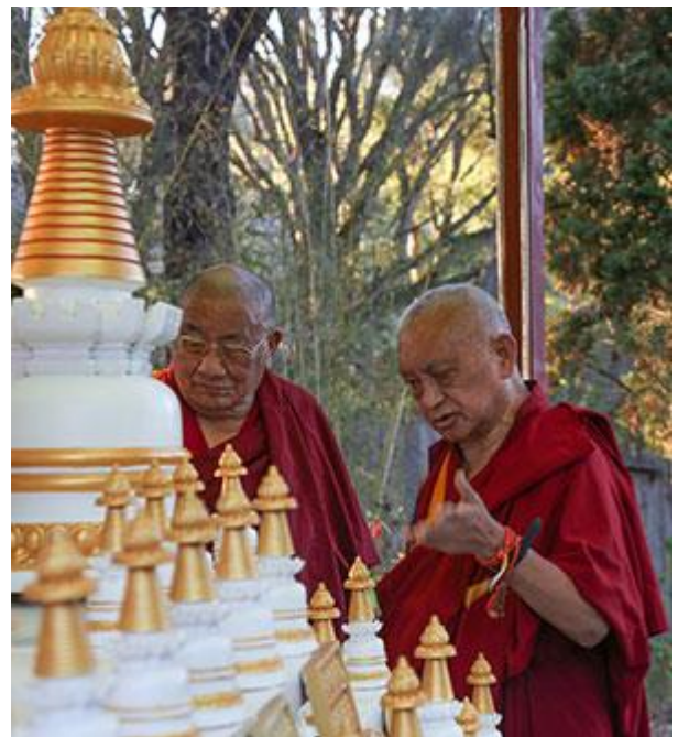
Lama Zopa Rimpoché con Geshe Ngawang Dakpa, California, US, Octubre 2015.

Estamos muy complacidos de anunciaros que los Proyectos Maitreya en India van adelante. Lama Zopa Rimpoché ha aconsejado que las reliquias que están viajando por todo el mundo en el Maitreya Loving Kindness Tour deberían colocarse como colección permanente en los Proyectos Maitreya de Bodhgaya y Kushinagar, India, ya que Rimpoché siente que es muy importante que las reliquias estén en los lugares de peregrinaje de modo que se las pueda visitar y admirar mientras se construyen las estatuas.