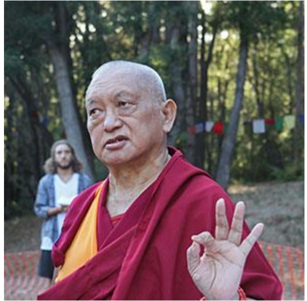
Lama Zopa Rimpoché en Land of Medicine Buddha, USA, Octubre 2015.