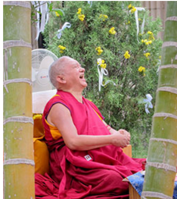
Rimpoché disfruta de un almuerzo en Osel Labrang, Sera, India, Noviembre 2012.

Seguiremos informando sobre cualquier novedad o noticia por medio de este boletín electrónico, o a través del sitio oficial, Salud de Rimpoché. < http://www.fpmt.org/teachers/zopa/rinpoches-health-updates-and-practices.html >