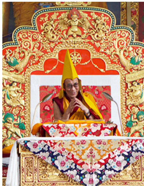
Su santidad el Dalái Lama durante las enseñanzas de Jangchub Lam rim, en el Monasterio de Drepung, al sur de la India. Diciembre 2012.