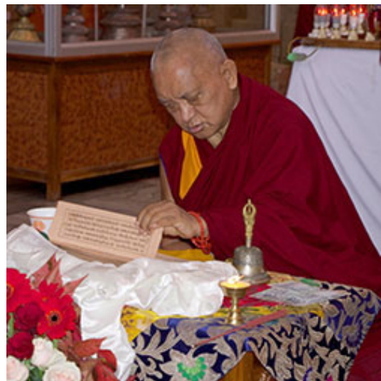
Rimpoché durante la puja de Hayagriva que patrocinó en Sera Je, India, nov. 2012.

«Gracias a aquellos que iniciaron el centro, y también a todos los demás que estudian y practican, y a aquellos que acuden a él de vez en cuando y que lo ayudan de forma física y mental. ¿Qué puede valer más la pena? Esta es sin duda la causa de una vida más feliz.