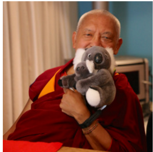
Lama Zopa Rimpoché con unos koalas, Blue Mountains, NSW, Australia, Junio 2015.