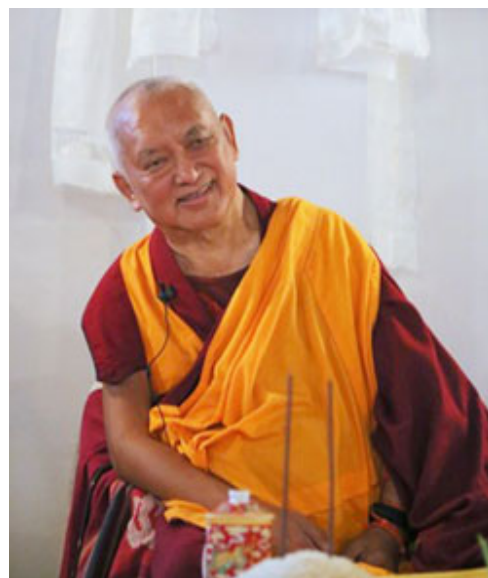
Lama Zopa Rimpoché, India, Febrero 2015.