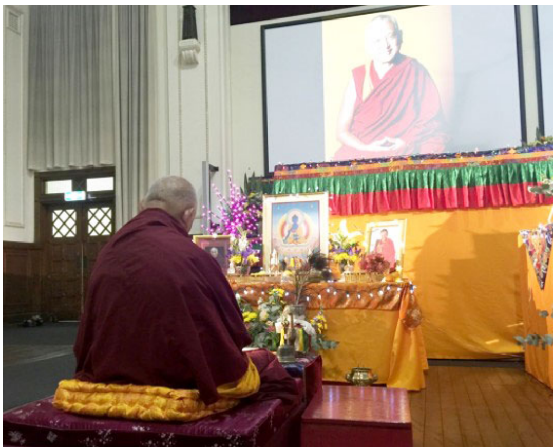
Lama Zopa Rinpoche durante una preparación, Buddha House, Australia, Mayo 2015.

Encontrarás una amplia variedad de consejos de Lama Zopa Rinpoche, en inglés en Rinpoche's Advice page . Visita también Lama Yeshe Wisdom Archive para más consejos de Lama Zopa Rinpoche. Mantente informado con Lama Zopa Rinpoche News .