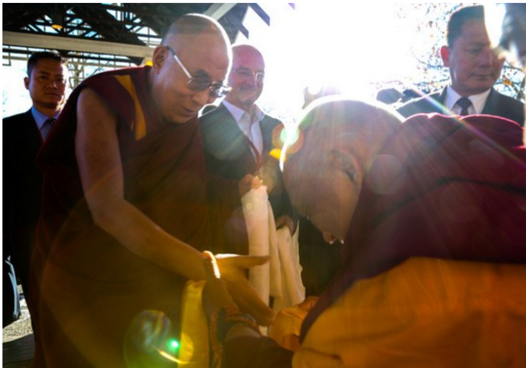
Lama Zopa Rimpoché con Su Santidad el Dalai Lama, Blue Mountains, NSW, Australia, Junio 2015.

Pema Dhondup, un cineasta tibetano que reside en Los Angeles va a estrenar el 6 de julio 2015 un documental corto titulado The Letter («La carta»). Es un anticipo de una serie y video que proyecta hacer titulada Search («Búsqueda») que cubre toda la historia de la institución del Dalai Lama desde 1391 cuando en una familia nómada nació Pema Dorje que más tarde se convertiría en el Primer Dalai Lama Gedun Drubpa. Para conocer más detalles del proyecto visita la página: www.searchdalailama.com . Si deseas ver o proyectar el corto a familia y amigos el 6 de julio, 2015 contacta por favor con Pema Dhondup .