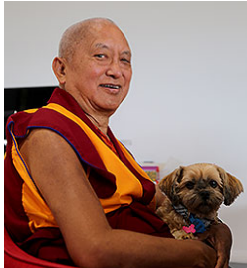
Lama Zopa Rimpoché con un nuevo amigo, Adelaide, Australia, Junio 2015.

5 – 12 de septiembre: retiro de Lam-rim en México .