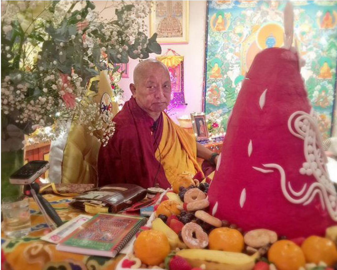
Lama Zopa Rimpoché en Buddha House, Australia, Mayo 2015.