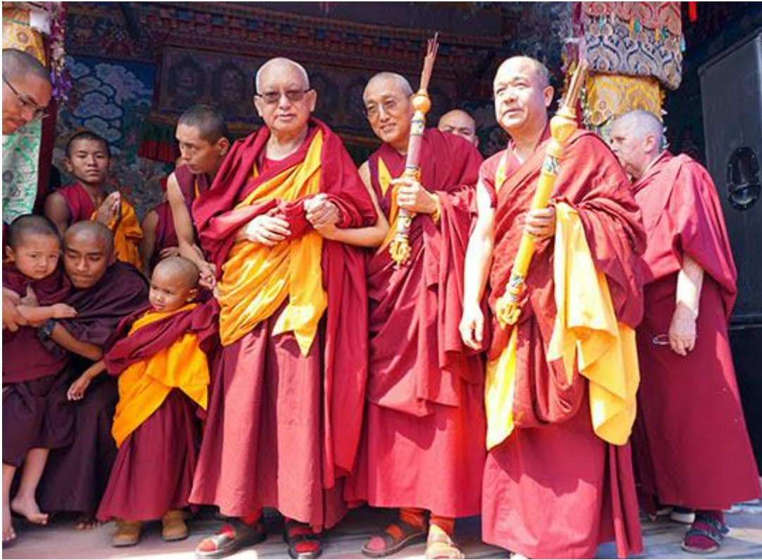
Lama Zopa Rimpoché con Thubten Rigsel Rimpoché, Khen Rimpoché Geshe Chonyi y Losang Namgyal Rimpoché, Monasterio de Kopan, Nepal, marzo de 2017.