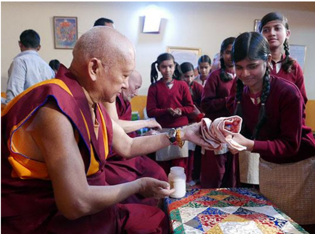
Lama Zopa Rimpoché ofreciendo regalos a los niños en la escuela Maitreya de la FPMT, Bodhgaya, India, enero de 2017.