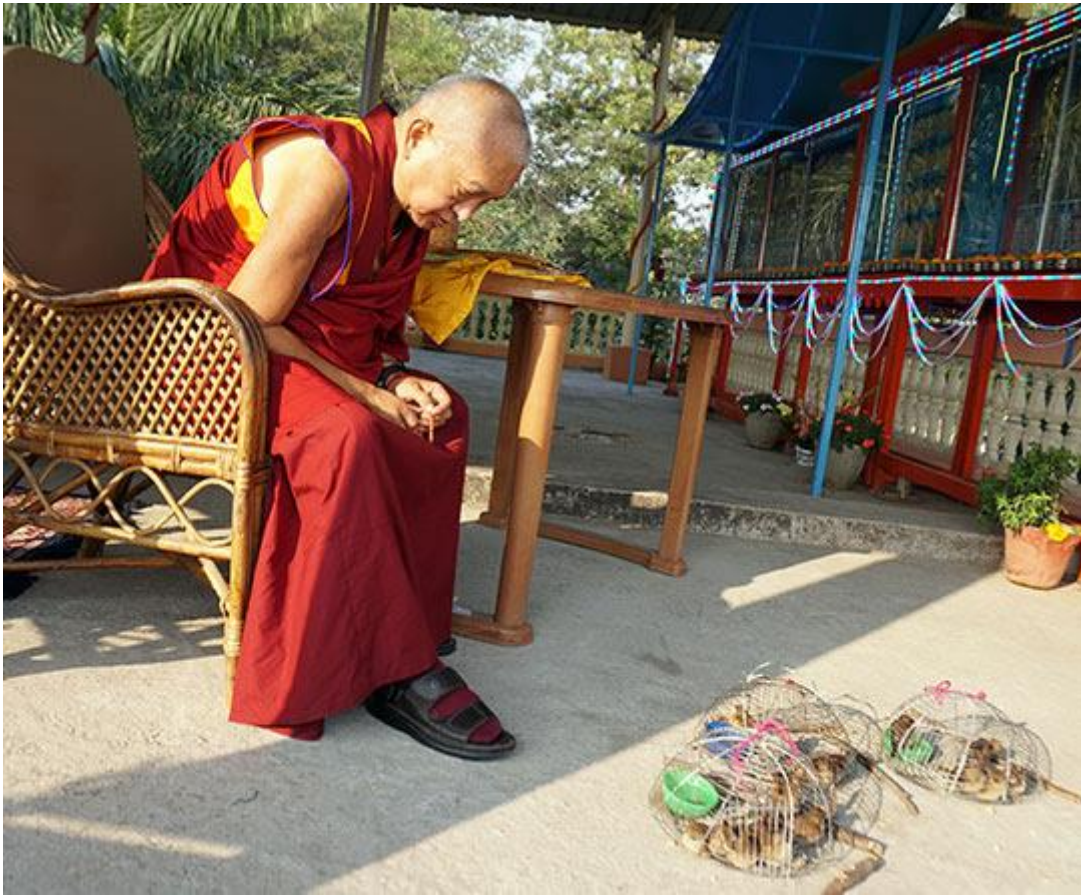
Lama Zopa Rimpoché bendiciendo a unos pájaros en Bodhgaya, India, enero de 2017. Las aves son liberadas de las jaulas después de haber sido bendecidas.