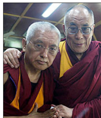
Rimpoché con Su Santidad el Dalai Lama, en Dharamsala, India, en Julio de 2010.