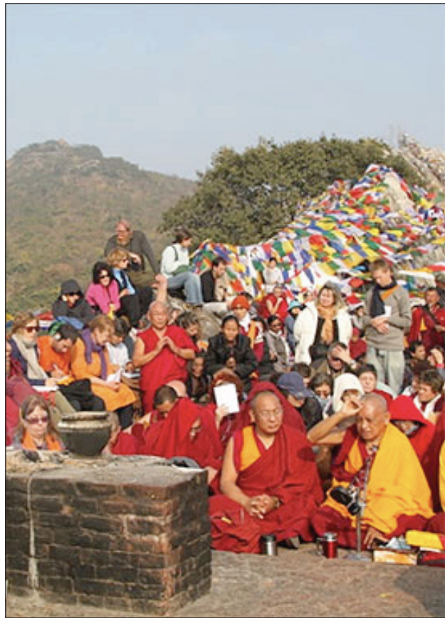
Enseñanzas en el Pico del Buitre, 2010.

Día 6 de enero: La organización Tibetanos para una sociedad vegetariana organizaron una manifestación con velas, encabezada por Lama Zopa Rimpoché y Richard Gere, desde el emplazamiento de la Mahabodhi Society de Sri Lanka, hasta la Mahabodhi Stupa . Rimpoché dio una pequeña charla dentro de los jardines de la estupa y guió la circunvalación de miles de tibetanos y no tibetanos alrededor de la korwa exterior, orando y portando las velas, al tiempo que se mezclaban con los otros peregrinos que circunvalaban la estupa; la multitud aumentó al unirse los monjes que habían finalizado la última sesión de las oraciones gelugpas. También no nos podemos olvidar el gran número de periodistas que corrían de espaldas para poder fotografiar la cabeza de la manifestación, mientras otras personas intentaban tocar a Richard Gere, todo ello creaba una atmósfera caótica pero al mismo tiempo alegre. En definitiva, fue un gran éxito para el movimiento vegetariano.