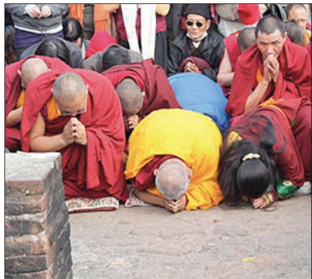
Los votos del bodisatva con Rimpoché en el Pico del Buitre 2010.

Día 5 de enero: Fue el primer día de enseñanzas de Su Santidad el Dalai Lama, a las que atendieron miles de tibetanos y extranjeros, a la vez que fue un impresionante encuentro de lamas, incluyendo el Gyalwa Karmapa y el nuevo abad Khensur Rimpoché Jangtse Choj, Lobsang Tenzin, el cual acababa de guiar un retiro de Tara en el Root .