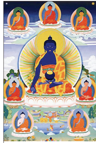
Espléndida thangka del Buda de la Medicina, en Land of Medicine Buddha .