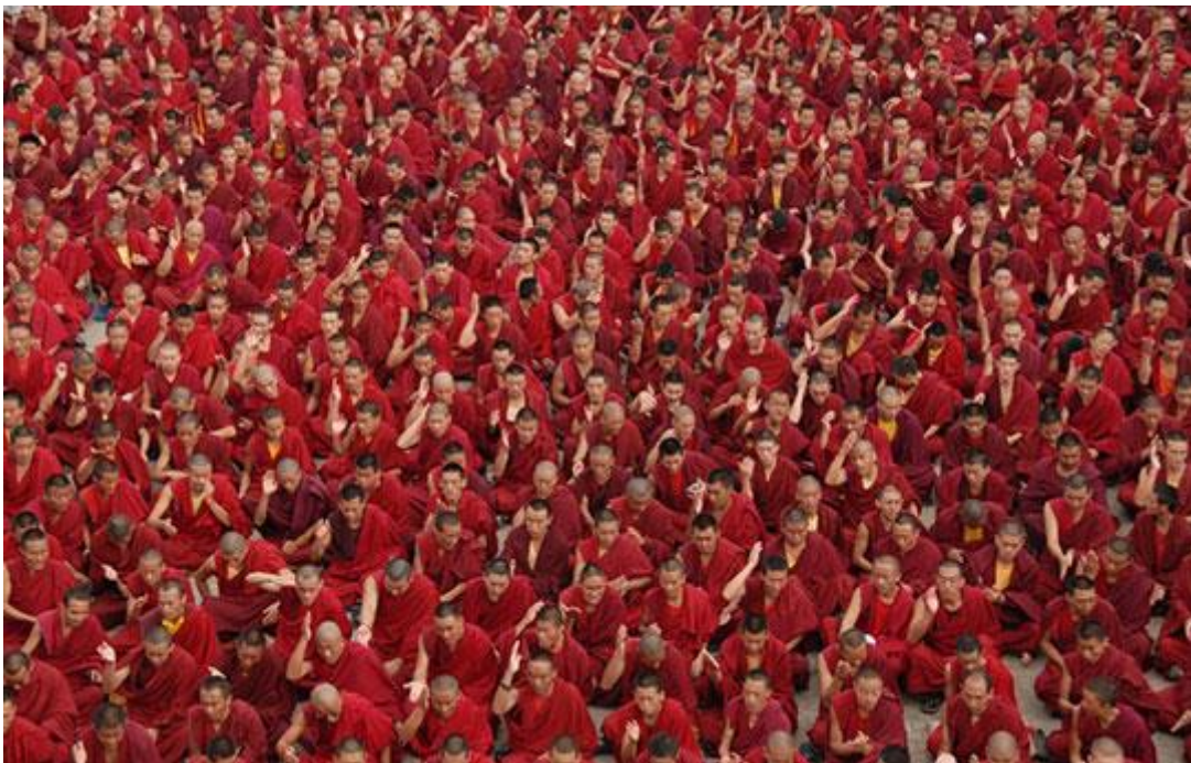
Algunos de los 15,650 Sangha ofreciendo oraciones durante el Losar