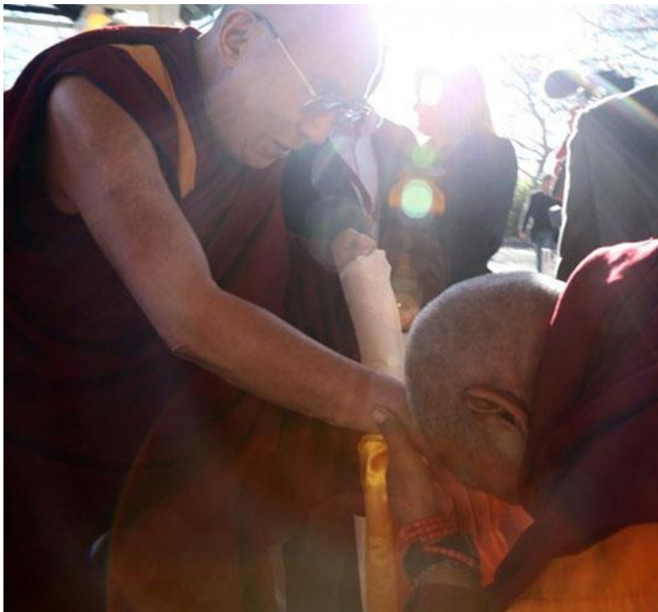
Su Santidad el Dalai Lama y Lama Zopa Rimpoché, Blue Mountains, Australia, Junio 2015.

Consejos sobre qué prácticas hacer para la buena salud y larga vida de Su Santidad el Dalai Lama