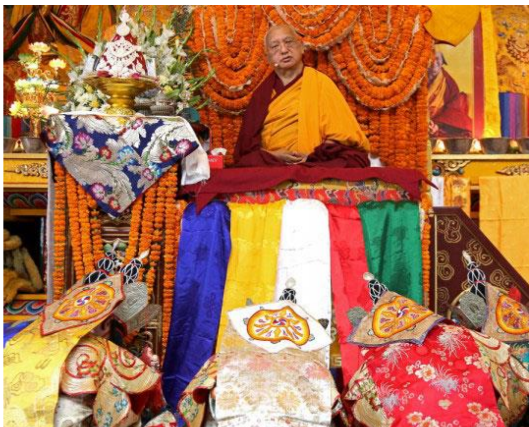
Lama Zopa Rimpoché durante la puja de larga vida que le fue ofrecida en el Monasterio de Kopán, Nepal, Diciembre 2015.