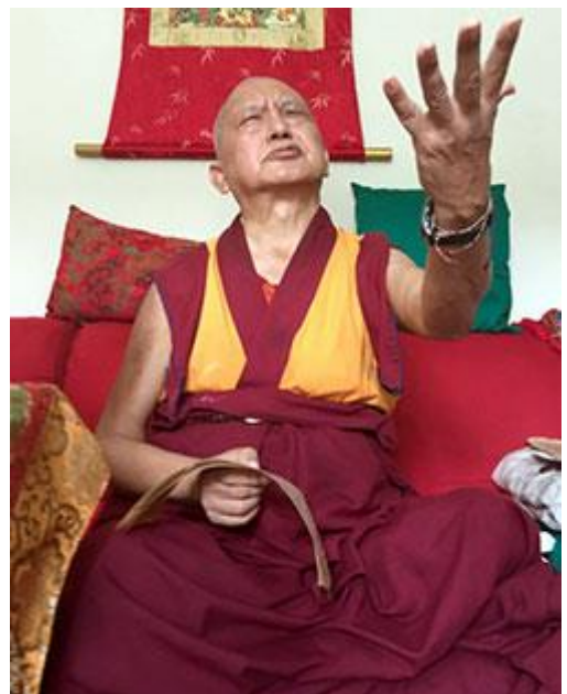
Lama Zopa Rinpoche en Brasil, septiembre 2015.