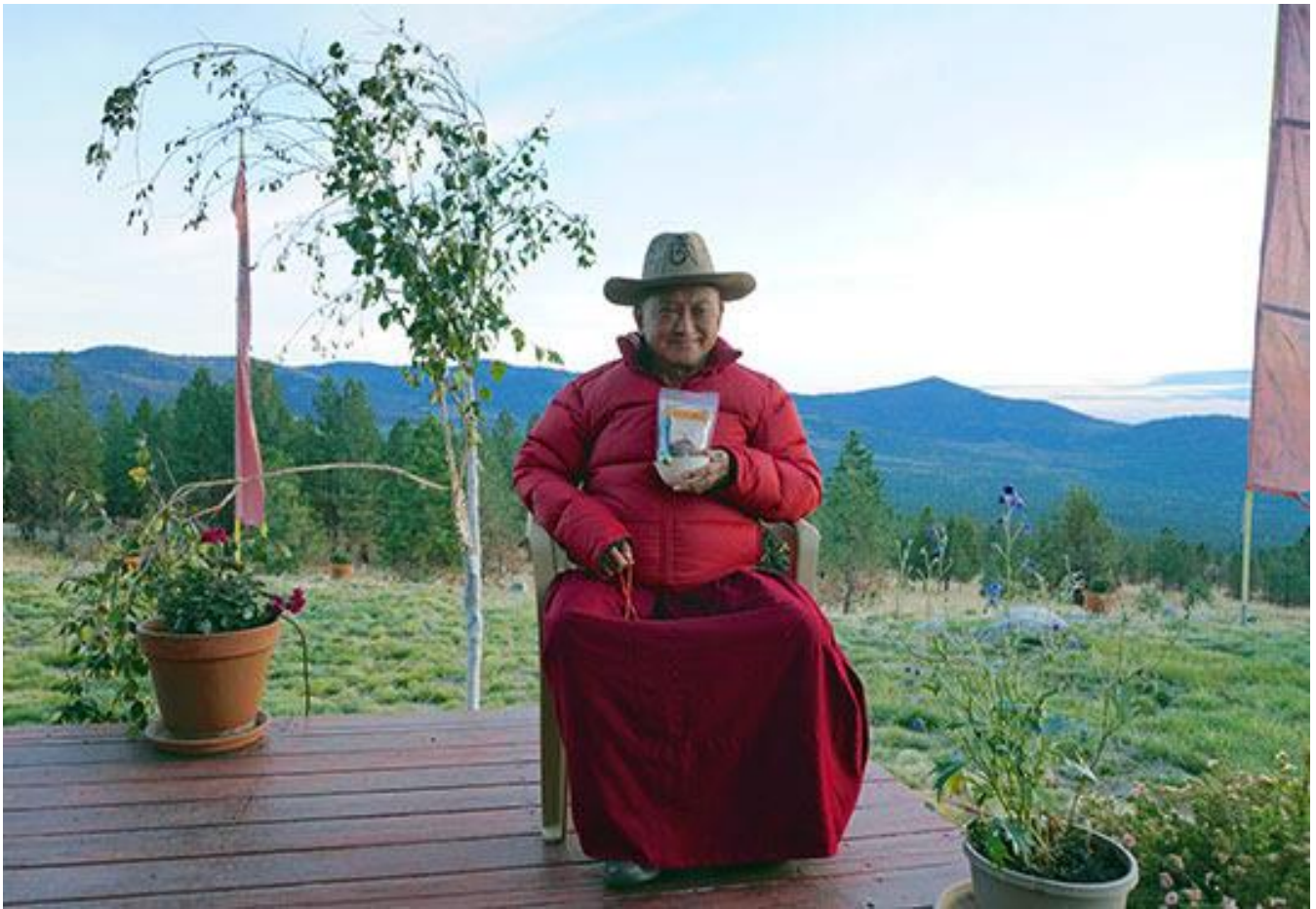
Lama Zopa Rimpoché con su sombrero mantra y sosteniendo el té que le ofreció el Kunsang Yeshe Retreat Centrt, estado de Washington, EEUU, noviembre de 2016.