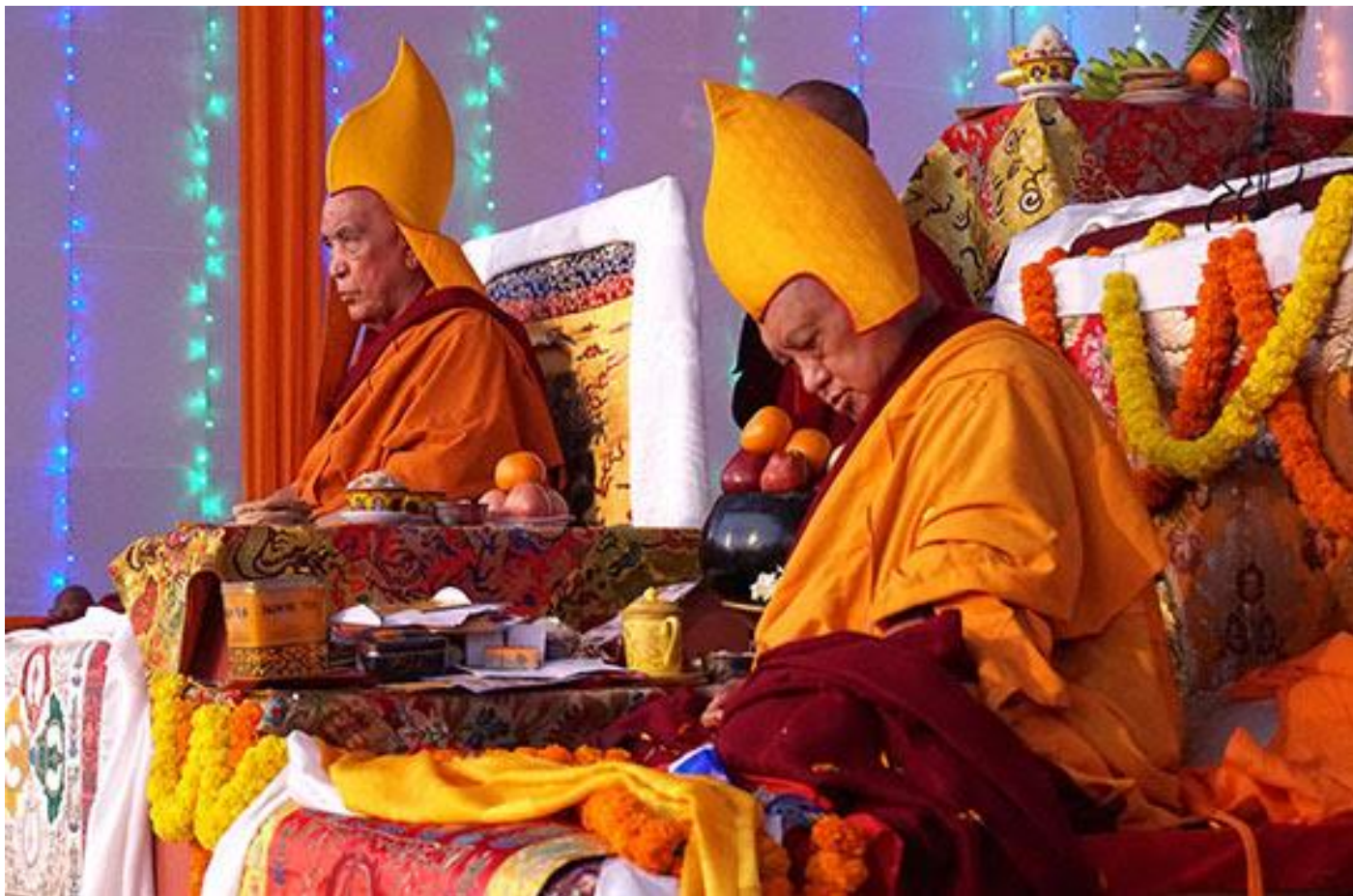
Jangtse Chöje Rimpoché y Lama Zopa Rimpoché durante la puja de larga vida ofrecida a Lama Zopa Rimpoché en Bodhgaya, el 2 de enero de 2017.

¡Puja de larga vida para Lama Zopa Rimpoché por el monasterio de Sera Je!