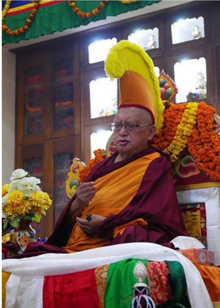
Lama Zopa Rinpoche durante la puja de larga vida ofrecida por las monjas de Kopan, en Sarnath, India, 18 de enero de 2017.

iTashi Delek en Losar! ¡Feliz año nuevo tibetano a todos nuestros queridos amigos! Con amor, de Lama Zopa Rinpoche y Todos los miembros de la Oficina Internacional de la FPMT.