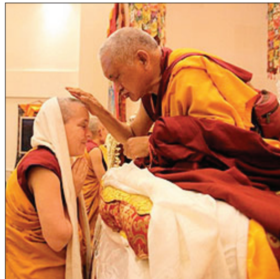
Rimpoché con la Ven. Joan Nicell en el centro ABC.

Más de cien personas asistieron a las enseñanzas, incluyendo 40 extranjeros de diferentes países, entre los que encontramos Malasia, Singapur, Chile, España, USA, Bélgica, México y Suiza, de los cuáles 23 eran miembros de la sangha monástica. Durante la comida de gala