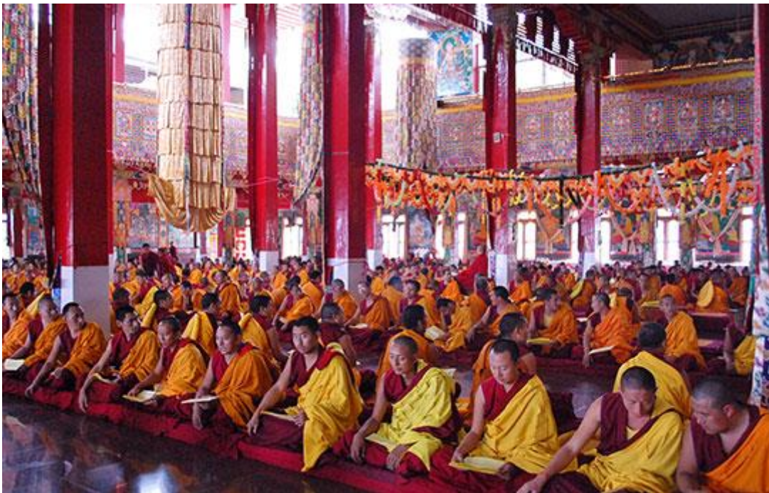
Monjes del monasterio de Sera Me ofreciendo una puja

En Saka Dawa, que tuvo lugar este año el 21 de mayo, un número increíble de miembros de la sangha 15.50 ofrecieron oraciones en nombre de toda la organización de la FPMT. Los miembros de la Sangha recitaron el Prajñaparamita y Las Alabanzas a tara 100.000 veces, ofrecieron pujas, presentaron ofrecimientos extensos a los gurus de Lama Zopa Rimpoché y ofrecieron ropas a los objetos sagrados en India y a la estatua