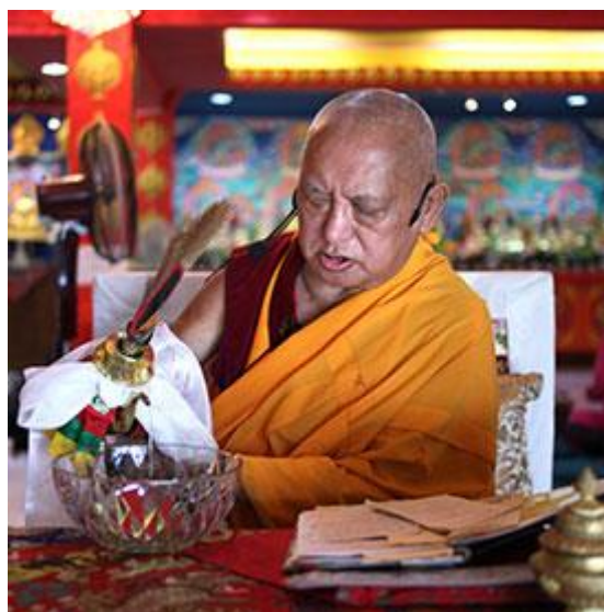
Lama Zopa Rimpoché haciendo una práctica de purificación (y de ayuda para la lluvia) frente al jardín del centro Losang Dragpa, Kuala Lumpur, Malasia, Abril 2016.