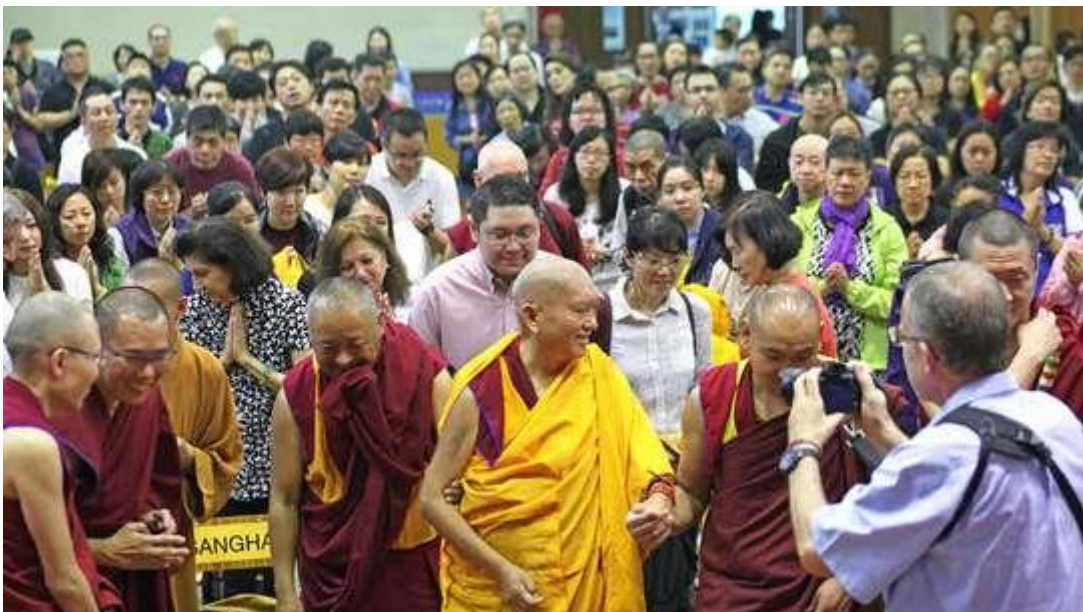
Lama Zopa Rimpoché entrando en el lugar de las enseñanzas, Hong Kong, Mayo 2016.

Rimpoché también comentó que originalmente fue idea de Lama Yeshe el que cada centro se concentrara en alguna medida en practicar la deidad que daba nombre al centro, así que el Institut Vajra Yogini está haciéndolo muy bien.