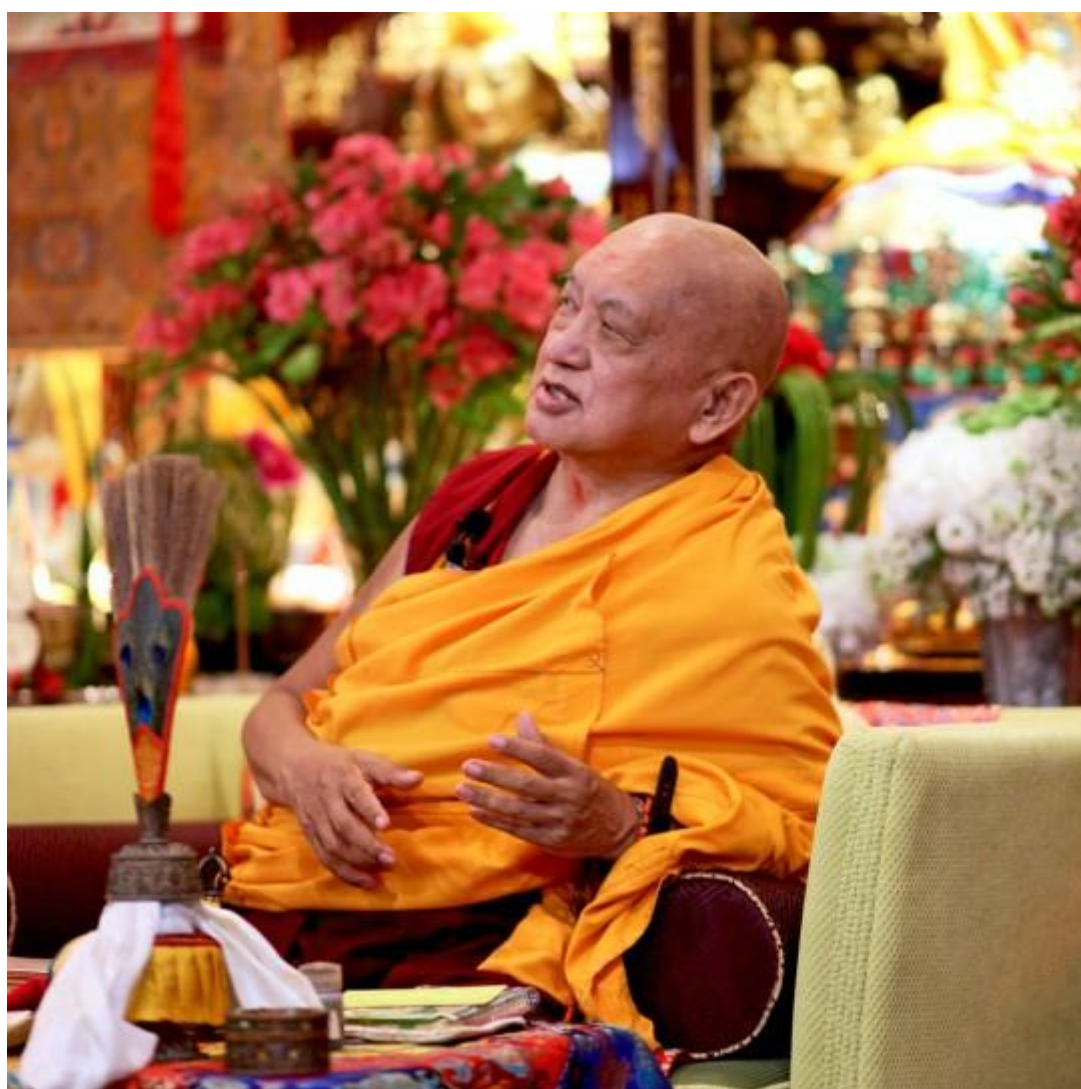
Lama Zopa Rinpoché enseñando en la Mahayana Buddhist Association, Hong Kong, Mayo 2016.