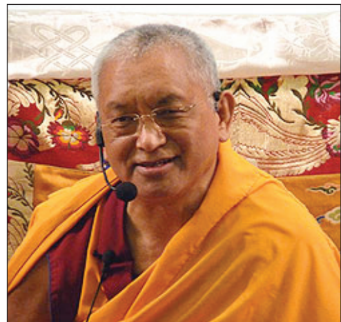
Lama Zopa Rinpoche durante el retiro de 'Una luz en el camino', setiembre de 2009.