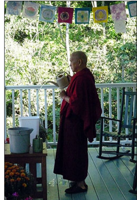
Rimpoché hace ofrecimientos a los pretas durante el retiro de Luz en el Camino de 2010.

Cuando abras cualquier puerta, piensa: Estoy abriendo la puerta de la sabiduría trascendental más allá del mundo, del samsara, por todos los seres. ¡Que pueda esto suceder!