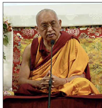
Rinpoché enseñando durante el retiro de Luz en el Camino de 2010 en Carolina del Norte en EUA.