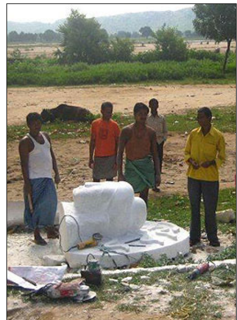
La estatua de Nagarjuna está siendo esculpida en mármol blanco de la mejor calidad.

El coste total de la estatua de de 38,000 dólares EUA y la mayor parte del dinero ha sido donado por los generosos estudiantes y los centros. Los fondos restantes provienen de la ofrenda recibida durante la puya de larga vida ofrecida a Rimpoché en Diciembre de 2009, en el Monasterio de Kopán.