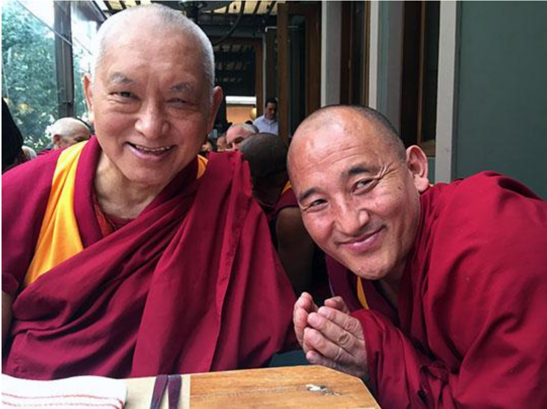
Lama Zopa Rimpoché con Geshe Kunkhen, gesheresidente del Centro Yamantaka, Colombia, Septiembre 2015.