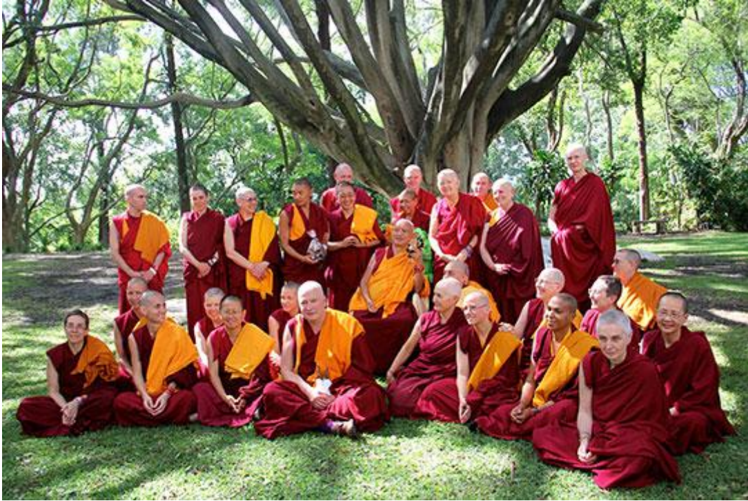
Sangha del IMI en el retiro con Lama Zopa Rimpoché en México, Septiembre 2015.