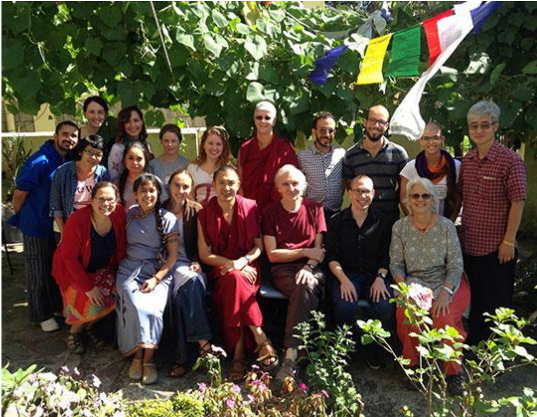
Estudiantes del LRZTP 7, Dharamsala, India, Octubre 2015.