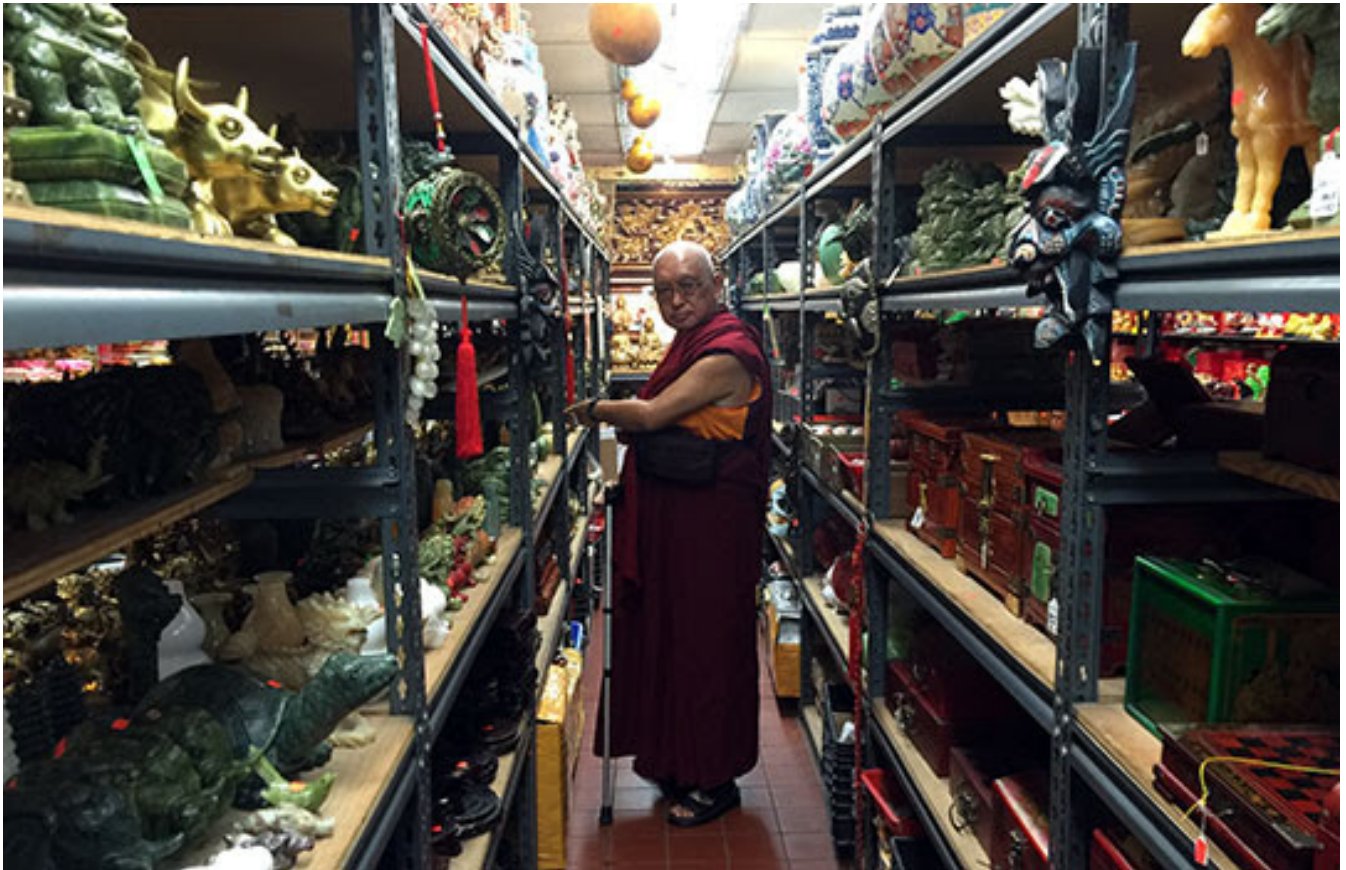
Lama Zopa Rimpoché de compras en Nueva York, EE.UU., 2016.