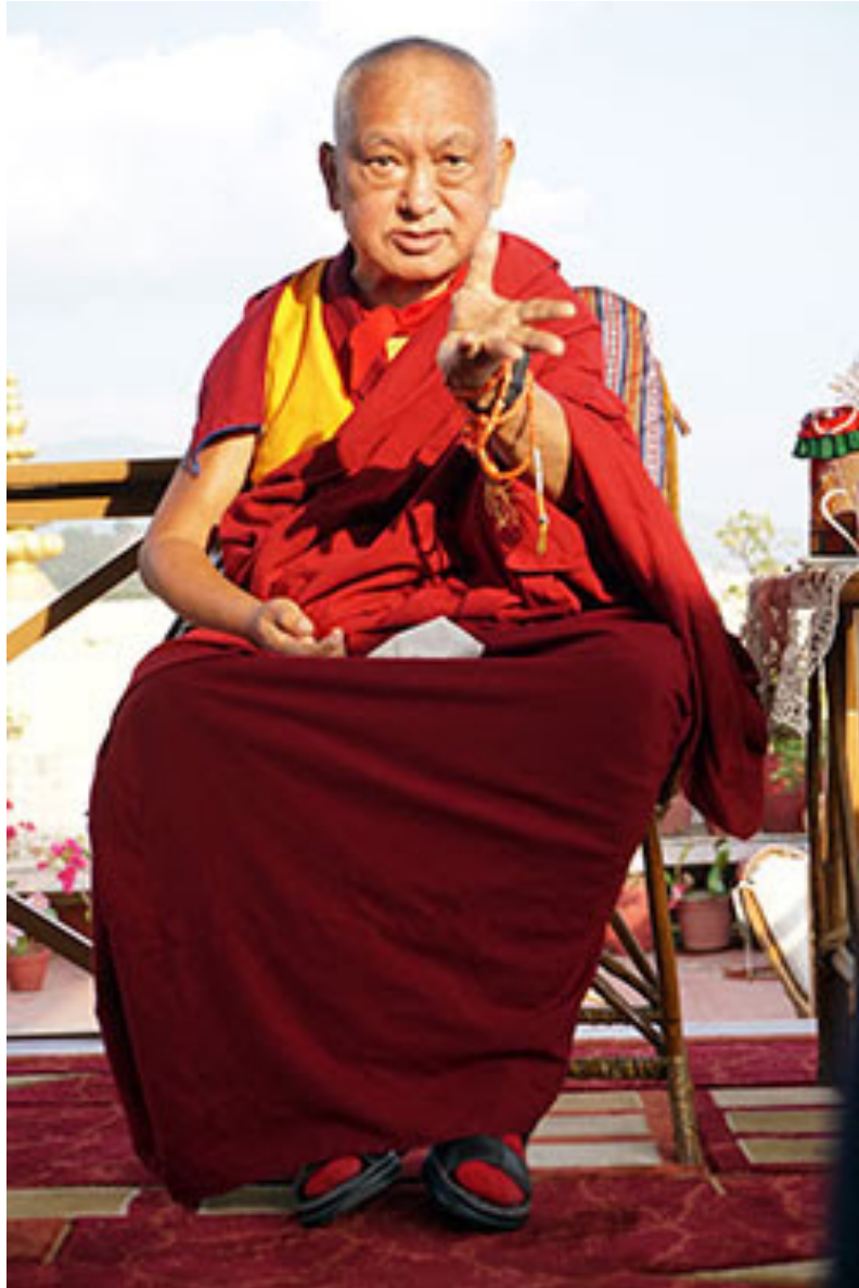
Lama Zopa Rimpoché, Monasterio de Kopan, Nepal, diciembre de 2016.

“Un amigo enfadado puede ser la persona más amable de tu vida”