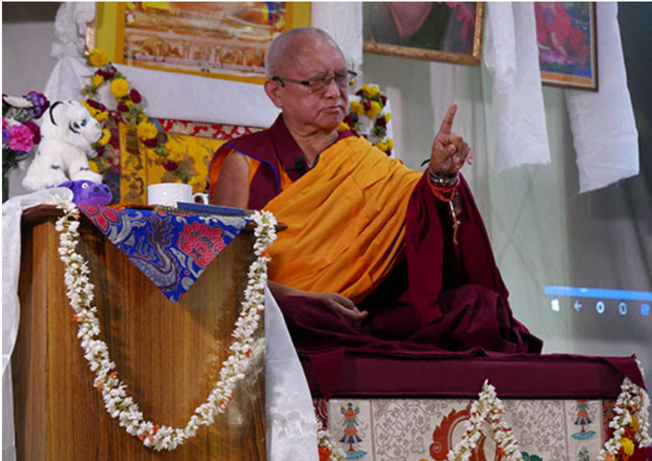
Lama Zopa Rinpoche impartiendo enseñanzas en Bangalore, India, diciembre de 2016.