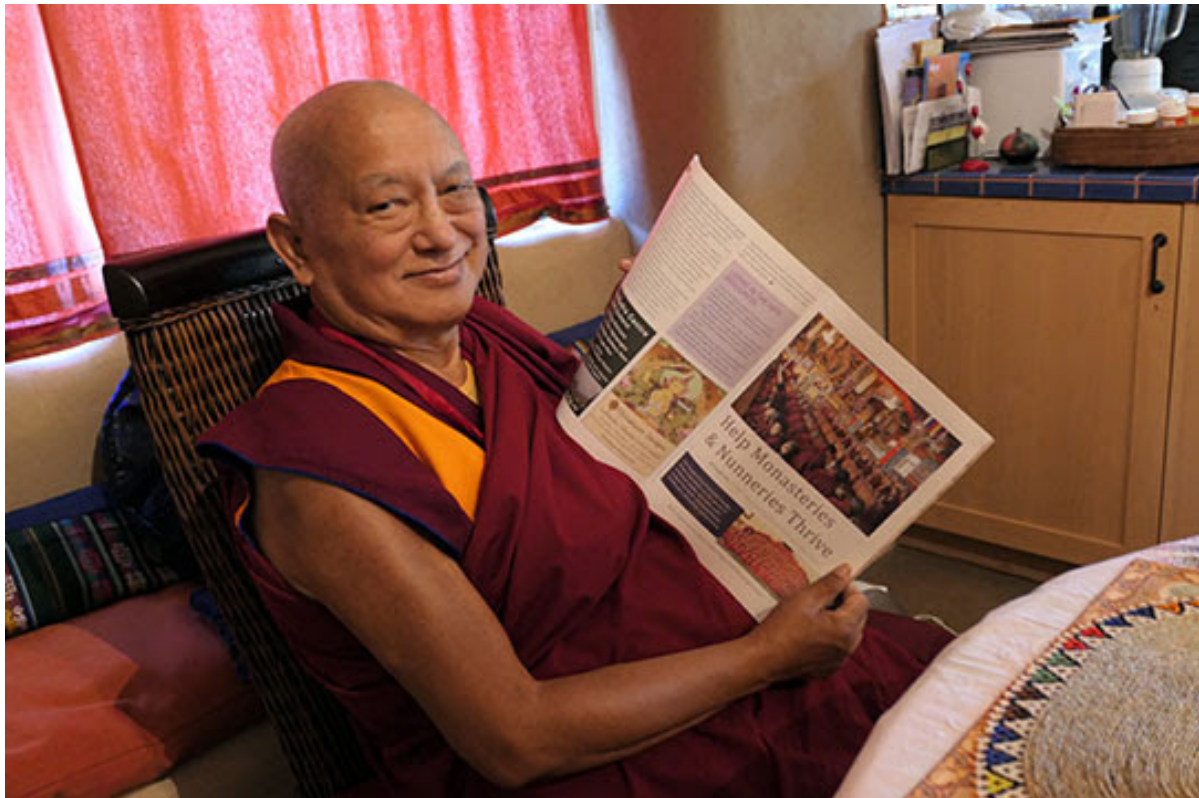
Lama Zopa Rimpoché disfrutando al leer sobre el Fondo de Apoyo a la Sangha Ordenada en el reciente número de la revista Mandala, agosto 2017

Te invitamos a regocijarte por las muy beneficiosas ayudas ofrecidas recientemente desde el Fondo de Servicios Sociales para el apoyo de proyectos sociales en Mongolia, India y Nepal. Han beneficiado ofreciendo: