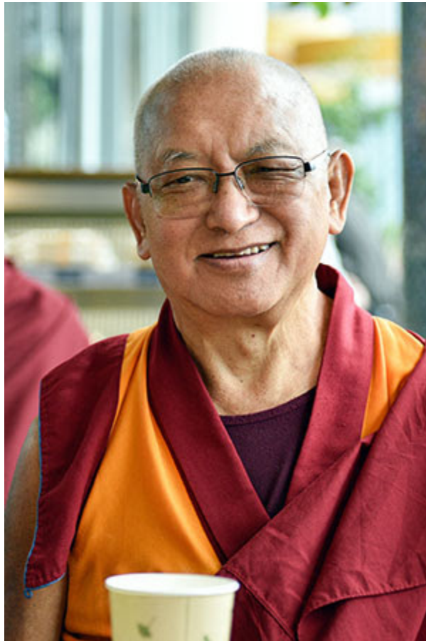
Lama Zopa Rimpoché, Rusia, junio 2017.

Lama Yeshe Wisdom Archive se complace de anunciar la publicación de Abiding in the Retreat: A Nyung Nä Commentary (Viviendo en retiro: un comentario sobre el Nyung Nä) por Lama Zopa Rimpoché, que introduce la práctica así: