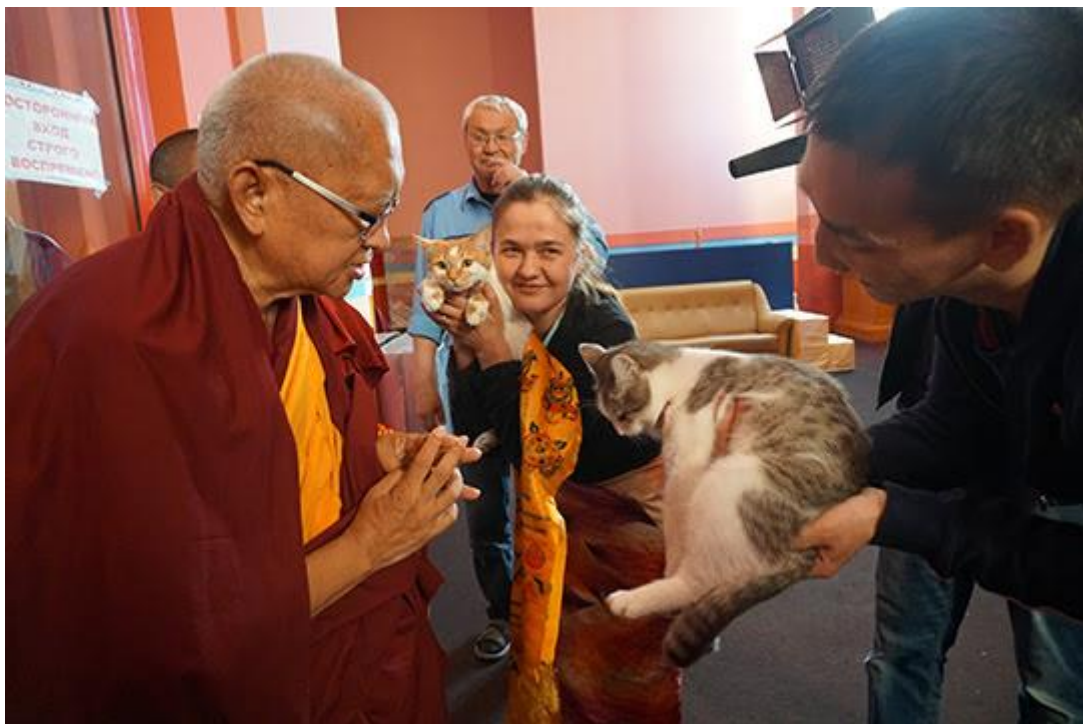
Lama Zopa Rimpoché bendiciendo gatos antes de dar la iniciación de Vajrasattva, Kalmykia, Rusia, Mayo 2017.

Por ejemplo, Mahamudra Centre , en Nueva Zelanda, necesita un/a jefe/a de operaciones.