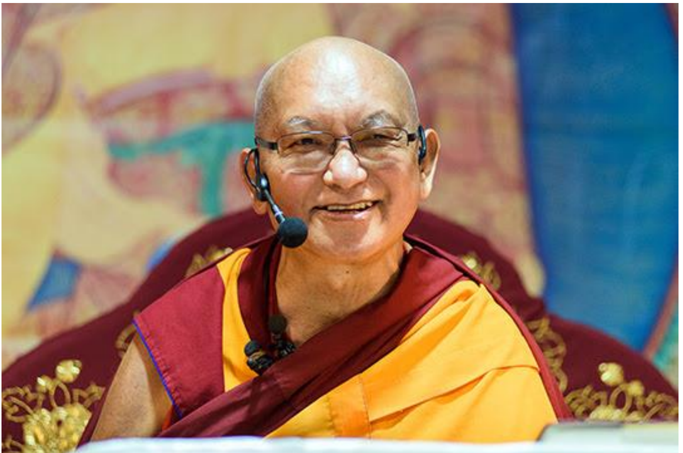
Lama Zopa Rimpoché impartiendo enseñanza en Moscú, Rusia, mayo 2017.

Trabaja un día para Rimpoché se ha convertido en nuestra campaña anual más popular para dar apoyo al trabajo de la Oficina Internacional de Lama Zopa Rimpoché. Este año participaron 450 estudiantes de 47 países, ofreciendo un día de sus ganancias laborales (u otra cantidad) a la visión compasiva de Rimpoché. Todas las contribuciones fueron dedicadas en Saka Dawa, el 9 de junio, de modo que el mérito generado fue 100 millones de veces más poderoso! Nos regocijamos y agradecemos a todos los que contribuyeron.