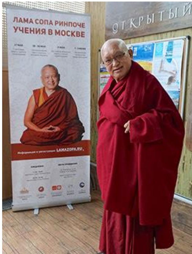
Lama Zopa Rinpoché en el lugar de celebración de sus enseñanzas en Moscú, Rusia, mayo de 2017.

Aquí tienes la agenda actual de Lama Zopa Rinpoché para 2017 y 2018.