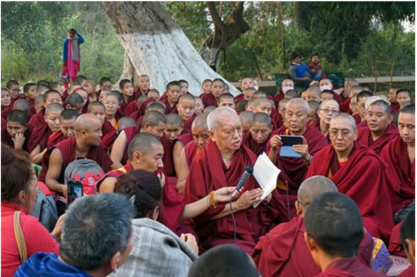
Lama Zopa Rimpoché impartiendo la transmisión oral de un texto de Mahamudra de Panchen Losang Chokyi Gyaltsen, Nalanda, India, enero de 2017.