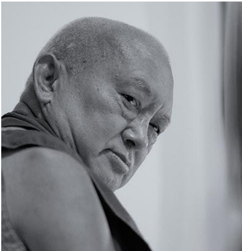
Lama Zopa Rinpoché, Italia, octubre 2017.

Este consejo va dirigido especialmente a aquellos que están ofreciendo este tipo de servicio.