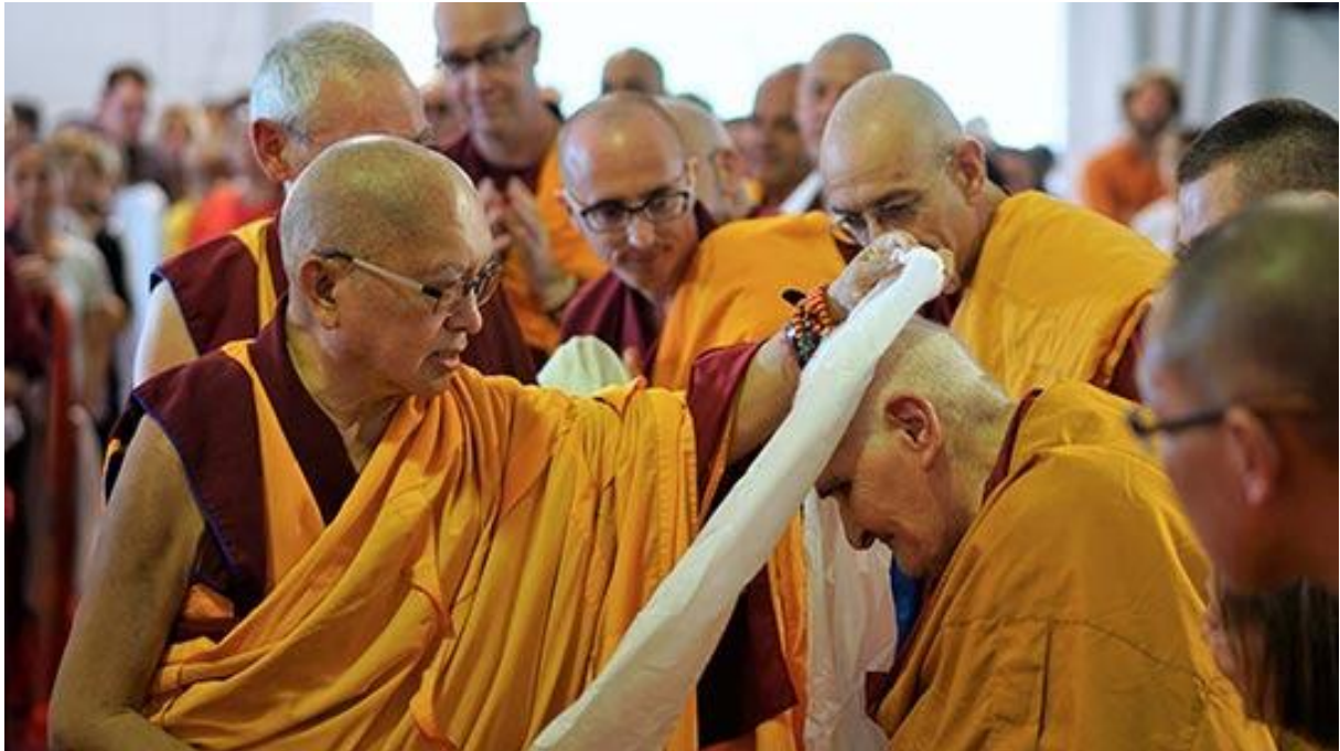
Lama Zopa Rimpoché entrando en la carpa de la gompa en el Retiro de 100 Millones de Manis, Italia, octubre 2017.