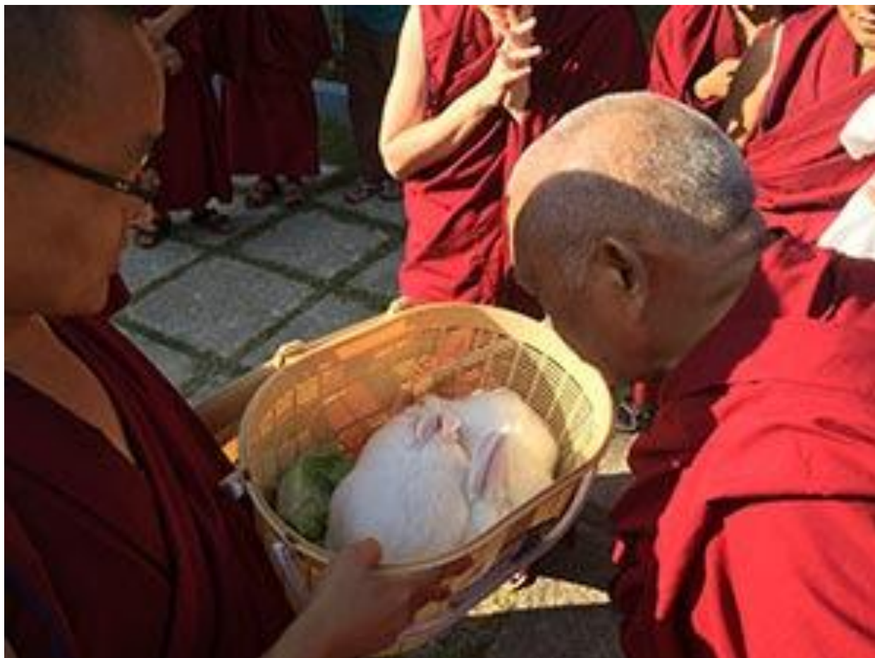
Lama Zopa Rinpoché bendiciendo conejos en Osel Labrang, Monasterio de Sera Je, enero 2016.